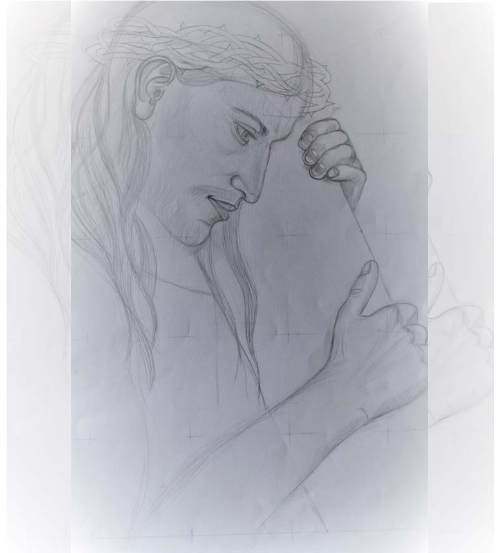
„Kreuzweg“ Beesen