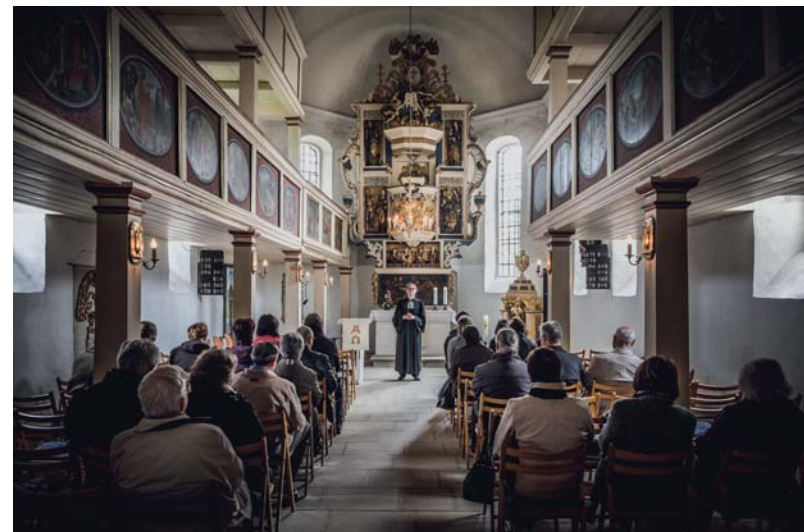
Der Innenraum der Elisabethkirche - ein Ort um Gemeinschaft im Glauben zu erleben.

Wenn du Interesse hast, komm einfach mal vorbei oder schreibe eine Mail an: debora.nagel@web.de Erster Termin im neuen Jahr: 08.01.2018.